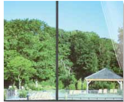
Prestige 90 Ulkokalvo