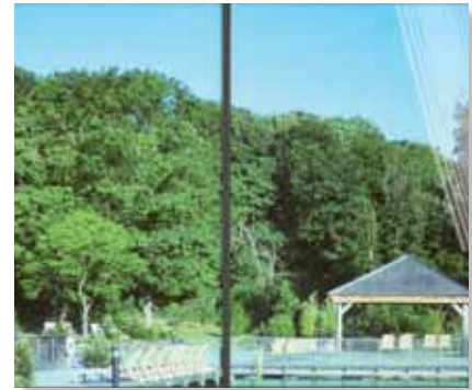
Prestige 70 Ulkokalvo