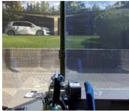
Prestige 40 ulkokalvo verrattuna metalloituun hopeakalvoon

3M Ikkunakalvot on suunniteltu vähentämään auringon lämmön ja näkyvän valon vaikutuksia kalusteisiin ja sisustustekstiileihin. Ne estävät jopa 99,9% auringon haitallisista UV-säteistä, jotka ovat suurin yksittäinen haalistumisen syy.