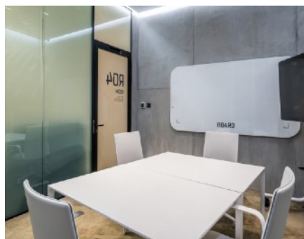
SONTE-älykalvo sumennetussa tilassa