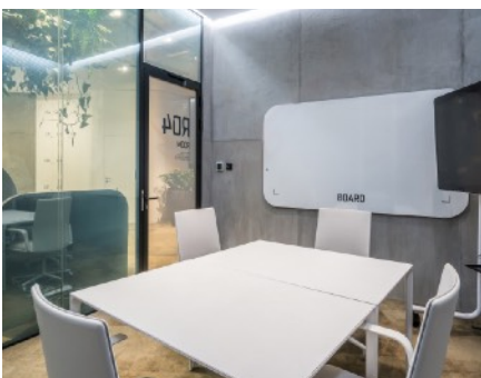
SONTE-älykalvo kirkaassa tilassa