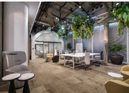
SONTE neuvotteluhuoneen liukuvissa

Kalvon tilan vaihtaminen läpinäkyvästä sumeaksi ja toisinpäin onnistuu kaukosäätimellä, seinäkytkimellä, älypuhelimien sovelluksella sekä toimiston tai kodin älyjärjestelmällä.